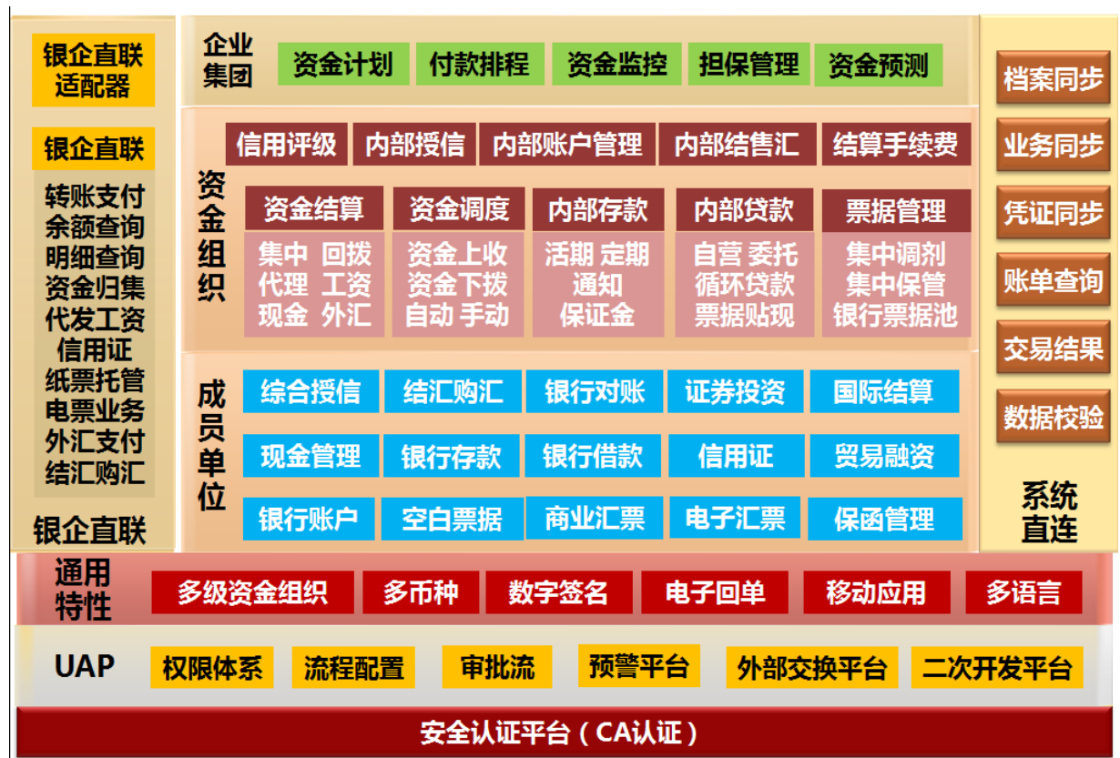
集团资金管理框架图

借助于网络技术和信息化手段,为建筑企业集团建立一个以资金平衡为基础,融合银行的金融服务,满足公司资金计划管理、结算业务管理、资金调度、财务核算、信贷业务、风险监管和决策分析一体化的集团资金管理平台。