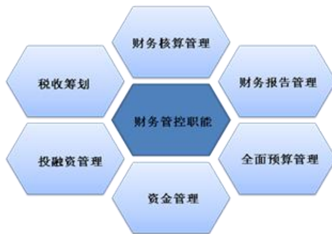
【集团财务管控体系框架】